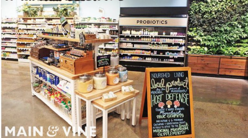
スーパーの一角とは思えない洗練されたコスメコーナーもハイパー一回りな商品で展開されている

ミレニアル世代をターゲットにした、効率的でそれぞれの「パーソナルウォンツ」に応える店づくりや、ノンフードコーナーでは単なる日用品ではなくエコ・健康・美容に力を入れた商品が多く見られました。