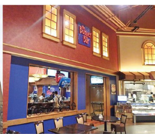
新たに導入した「PUB」やバーガーバーの展開を加速。店内の商材を使ったアルコールも飲めるフルサービスのインスタレストランに力を入れている。