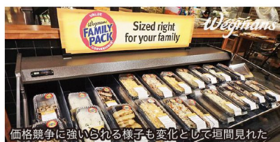
価格競争に強いられる様子も変化として垣間見れた

これまで絶対的地位を築いてきたと思われたウェグマンズやホールフーズにも時代の変化による大きな転換期が訪れていると感じた。価格面や新たなシステムの導入、またスーパーマーケットから「グロッサリー (グロッサリー&レストラン/食材+食事の提供)」へのシフトが行われ、新たなフォーマットを構築しているようです。