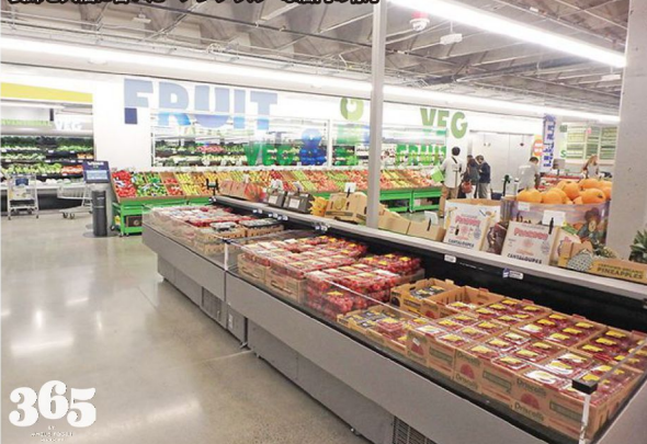
装飾を大幅に省いた「ノンフリル」な店内の様子

最終滞在地のシアトルでは、アーバン立地の店舗を中心に 8 店舗訪問。中でも、クロージャーが研究を重ねて出店した「MAIN&VINE」、日本とは全く異なる雰囲気の新協「PCC」、全米 3 店舗目の出店となるホールフーズの新業態「365 BY WHOLEFOODS MARKET」など新たな挑戦を行う企業の取り組みが印象的でした。