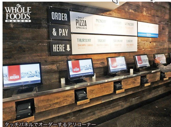
タッチパネルでオーダーするデリコーナ

日本を飛び立ちおよそ13時間。初日に訪れた首都ワシントンD.C.では、計9店舗のスーパーマーケットを視察しました。ウェグマンズの新しい試み、ホールフーズのトライアル店舗、変わらぬ独自路線を進むトレーダージョー... それぞれ数年前に見た店舗からのさらなる進化を肌で感じ、心踊る7日間の視察の始まりとなりました。