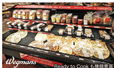
Ready to Cookも種類豊富

各社共、環境・資源問題の対策として、サステイナブルな商品の取り扱いを積極的に進めていること、廃棄・ロスを出さないために生鮮食品では真空パックやガスパックの商品が多く並んでいることなど、これまでのアメリカとは異なる点を多く感じ、取り組みに力を入れている様子が伝わってきました。